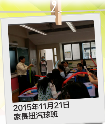
2015年11月21日 家長扭汽球班