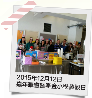
2015年12月12日 嘉年華會暨李金小學參觀日