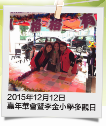
2015年12月12日 嘉年華會暨李金小學參觀日