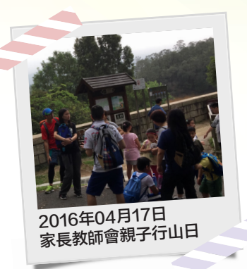
2016年04月17日 家長教師會親子行山日