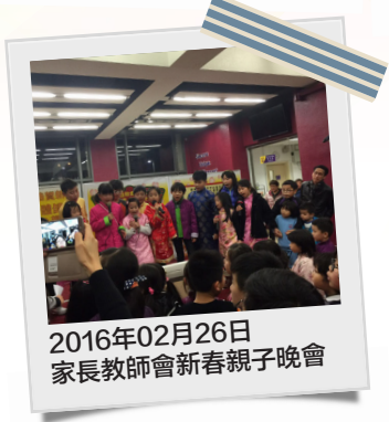
2016年02月26日 家長教師會新春親子晚會