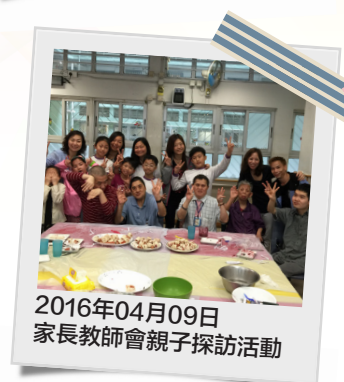
2016年04月09日 家長教師會親子探訪活動