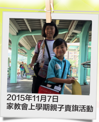
2015年11月7日 家教會上學期親子賣旗活動