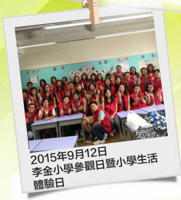
2015年9月12日 李金小學參觀日暨小學生活 體驗日