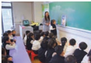
棄用傳統英文教學，利用故事書 教學，提升學習英語興趣