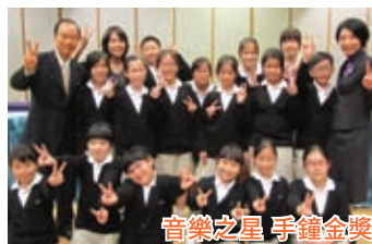
音樂之星 手鐘金獎

We love to learn. We learn to love. We are SUPER .