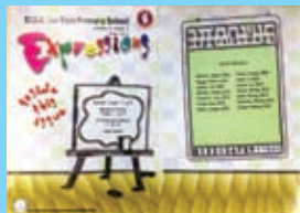
培育英文小作家，出版英文刊物