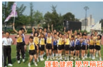
運動健將 學界稱冠