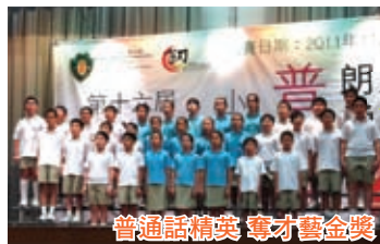
普通話精英 奪才藝金獎