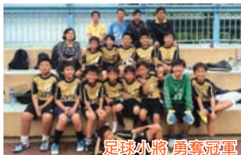
足球小將 勇奪冠軍