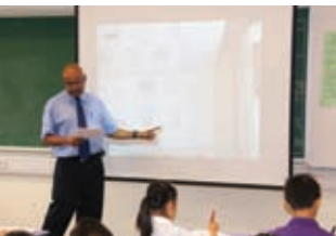
外籍英語教師教學