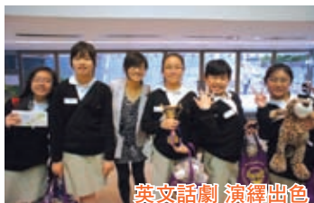
英文話劇 演繹出色