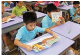
設學生每天英文早讀時間 (每天15分鐘)