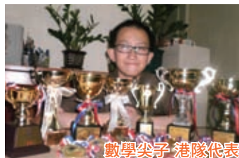
數學尖子 港隊代表