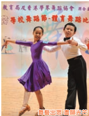
舞藝出眾 盡顯光芒