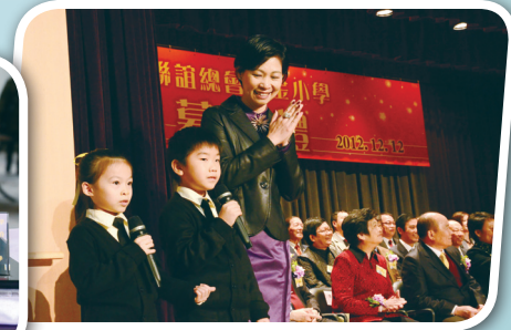
兩位一年級學生代表與蘇校長致謝辭