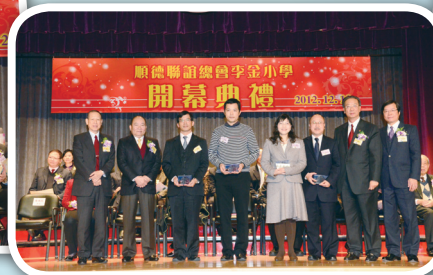
致送紀念品予教育局、建校組及建築商