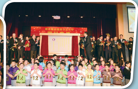
十二時十二分揭幕儀式進行中