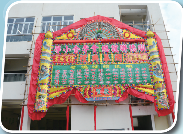
屬會學校送贈的傳統大花牌

本校於 2012 年 12 月 12 日舉行開幕典禮。當天學校門內門外均放滿各界致送的花籃及贈書，而屬會學校更送贈一個傳統大花牌，倍添氣氛。