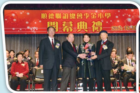
致送紀念品予主禮嘉賓