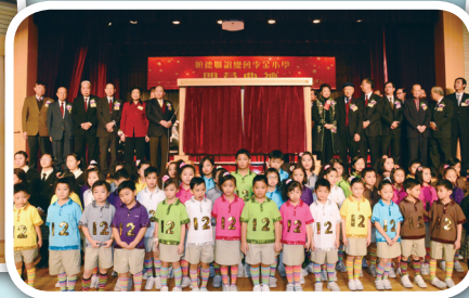
準備揭幕儀式的一刻