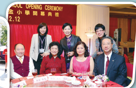
黃金海岸遊艇會午宴