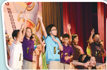
音樂劇建校篇之We are Super