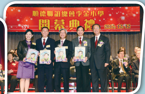
致送紀念品予協助籌辦李金小學的校長