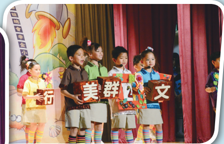
音樂劇建校篇之齊心建校