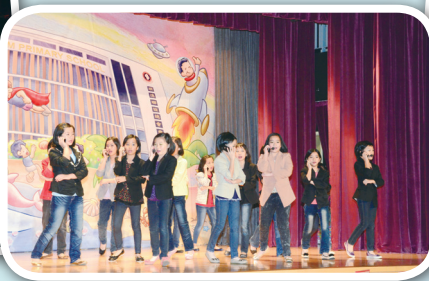
音樂劇建校篇之忙忙忙