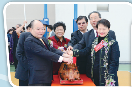
主禮嘉賓進行切金豬儀式